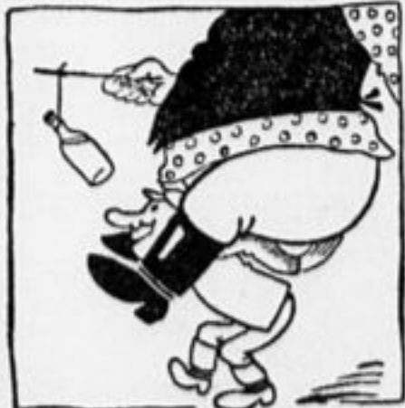
Ему и тяжесть ничем пр'манни такой ради, и,ит осодлан излпачем, — куда запачу надо.

— На рождество обязательно пойду на работу, — говорит отец. П. Курганов.