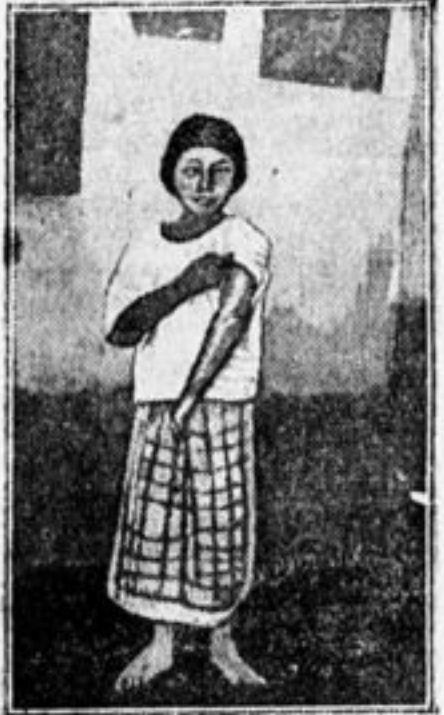
Девочка-рабыня показывает рубцы от истязаний.

Сколько-ж хочешь ты за души Катерины, Марфы, Груши, Парамона, Филимона Да за здравье Спиридона Мало те пятак? Пьявка ты,—не дьяк! Охо-хо, сбейдусь и так. Тыфу!»