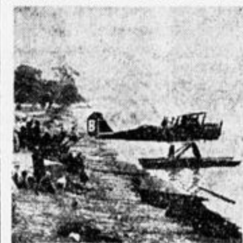
На охране советских границ.

(495), 78 отряд Бауманск. р-на (305), десятилетка водников Семипалатинска (257), ребята Судженского р-на (439), окречский отряд (260), 18 весп. школа Москвы (279), горевская семилетка, БССР (491), ребята Усвятск. р-на, Западной обл. (444), 9 школа Гомеля (222), 5 школа Лысьвы (394), 11-я школа 1 ст. Майкопа (293), ж.-д. школа 1 ступ., ст. Лихой (313).