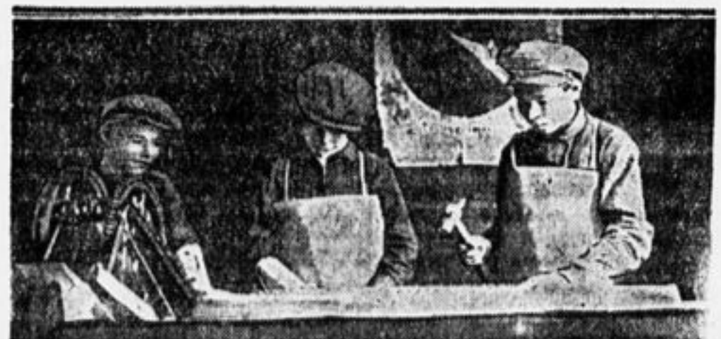
Фабзавучники за работой.

Опыт Днепропетровска должен послужить хорошим примером для всех других организаций, которые еще не приступили к выполнению задания ЦБ Ю. П. З. Х.