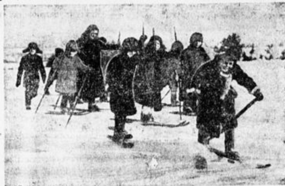
Колхозовские ребята на прогулке.

Но этого мало. Деревенские пионеры и школьники должны сейчас и весной МОБИЛИЗОВАТЬ